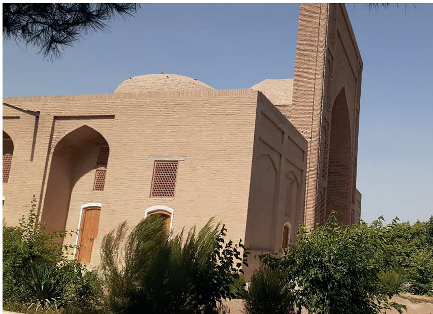
Ҳаким Термизий мақбараси (X-XIV асрлар)