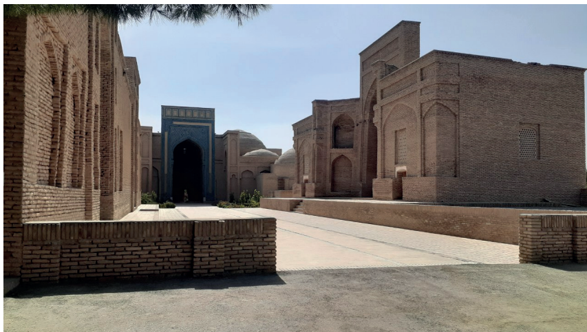
Султон Содот мақбаралар мажмуи (XI-XIX асрлар)