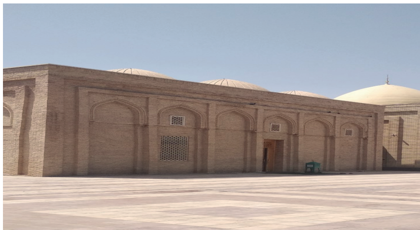
Абу Исо Термизий мақбараси (X-XI асрлар)