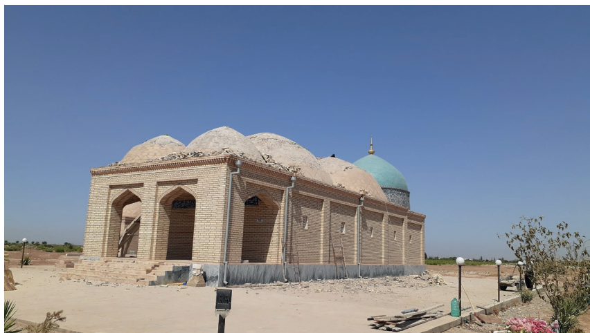
Такия ота зиёратгоҳи (тах. XII аср)