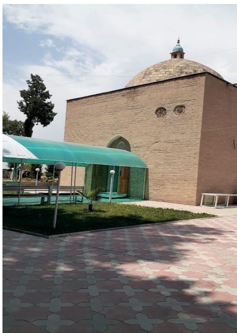
Оқ Остона бобо (Абу Хурайра) мақбараси (X-XI асрлар)