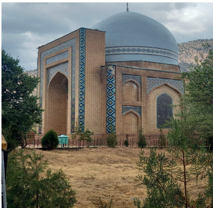
Сўфи Оллоёр зиёратгоҳи (XVII-XVIII асрлар)